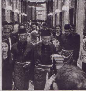
বৃহস্পতিবার রাজার সঙ্গে দেখা করে ফিরছেন মাহাথির মোহাম্মদ

ঘুরেফিরে সেই মাহাথিরের হাতেই মাতৃভূমি মালয়েশিয়াকে তুলে দিল মালয়রা। দেশ কারিগরের কাছেই দেশ ফিরিয়ে দিল জনগণ। আশা একটাই, জনকের হাতেই পুনর্জন্ম হবে মালয়েশিয়ার। দীর্ঘ ১৫ বছরের দুর্নীতি আর দুঃশাসনের দুর্গন্ধ দূর হবে এবার। আবার ঘুরে দাঁড়াবে মালয়েশিয়া। রাজগার বাড়বে, দ্রব্যমূল্য কমবে, সচ্ছলতা আসবে নাগরিক জীবনে। টানা ১৫ বছরেরও বেশি সময় মুখ ফিরিয়ে ছিলেন। সুযোগ দিয়েছিলেন উত্তরসূরিদের। কিন্তু শেষ পর্যন্ত চূপ থাকতে পারলেন না। আবার লাগাম ধরলেন। হাতেগড়া শিষ্য ও ক্ষমতাসীন প্রধানমন্ত্রী নাজিব রাজাককে তুড়িতে মসনদ ছাড়া করলেন আধুনিক মালয়েশিয়ার রূপকার ডা. মাহাথির মোহাম্মদ। গড়লেন আরেক নতুন ইতিহাস। ১৯৮১ থেকে শুরু করে ২০০৩ পর্যন্ত দীর্ঘ ২২ বছর সততা, দৃঢ়তা ও নিষ্ঠার সঙ্গে প্রধানমন্ত্রীর দায়িত্ব পালন করেন তিনি। ২০০৩ সালে স্বেচ্ছায় ক্ষমতা ছাড়ার আগে নাজিবকে উত্তরসূরি বেছে নেন তিনি। চেয়েছিলেন, উন্নয়নের যে মহাসড়কে তিনি মালয়েশিয়াকে রেখে এসেছেন, সে পথেই দেশের অগ্রগতি অব্যাহত রাখবেন নাজিব। কিন্তু কাঁচা হাতে ক্ষমতার দণ্ড পেয়ে তার অপব্যবহার করেছেন নাজিব। উন্নয়নের বদলে দেশকে অবনতির গভীর খাদের কিনারে নিয়ে গেছেন। নাজিবের বিরুদ্ধে রাষ্ট্রীয় কোষাগার থেকে কয়েক বিলিয়ন ডলার সরানোর অভিযোগ