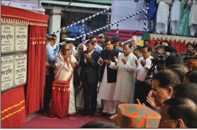
প্রকল্পের ভিত্তিপ্রস্তর স্থাপন করেন মাননীয় প্রধানমন্ত্রী শেখ হাসিনা