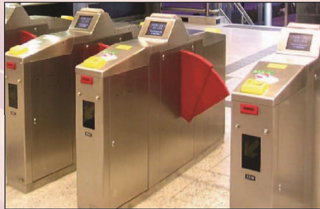
মেট্রোরেল ইলেকট্রনিক টিকেট গেট (প্রক্ষেপিত)