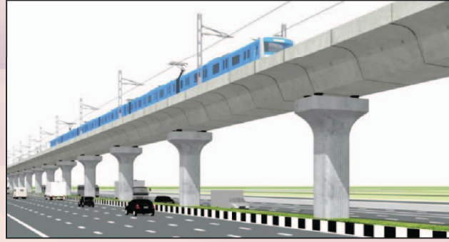
মেট্রোরেল লাইন (ভায়াডাক্ট)