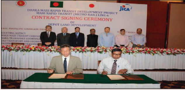
ডিপো এলাকার ভূমি উন্নয়ন কাজে Tokyu Construction Co. Ltd. এর সঙ্গে চুক্তি স্বাক্ষর