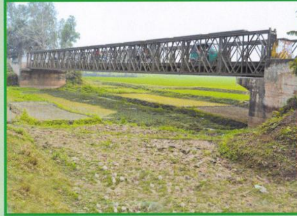
বগুড়া-সারিয়াকান্দি জেলা মহাসড়কের ১২তম কিলোমিটার এ বিদ্যমান জয়ভোগা সেতু