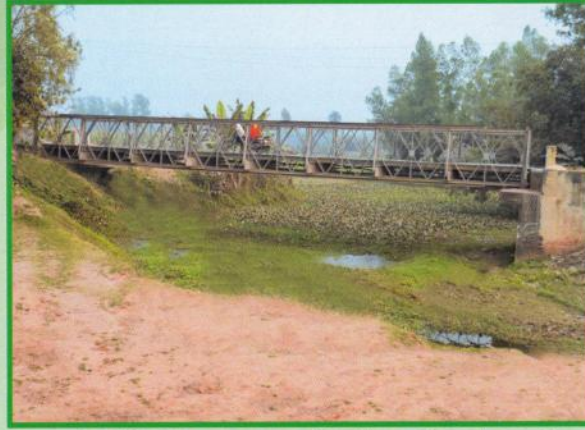
বগুড়া-সারিয়াকান্দি জেলা মহাসড়কের ৮ম কিলোমিটার এ বিদ্যমান খৈলসাকুড়ি সেতু