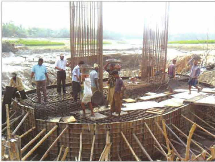
পাইল ক্যাপ নির্মাণ কাজ