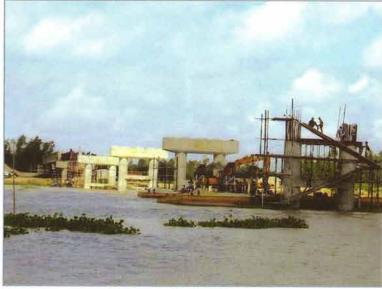
সেতুর পিয়ারের কাজ