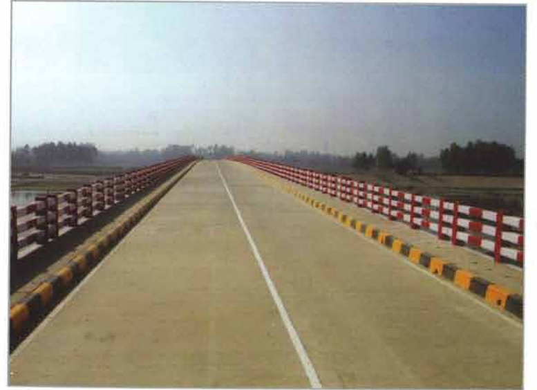
রেলিং ফুটপাথসহ ডেকস্লাব