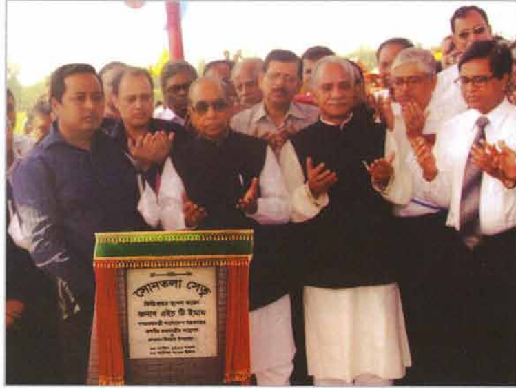
সোনাতলা সেতুর ভিত্তি প্রস্তর স্থাপন