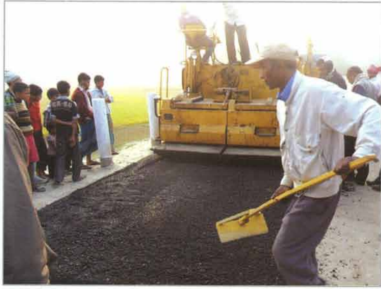
এ্যাথোচ সড়কে বিটুমিনাস কাজ