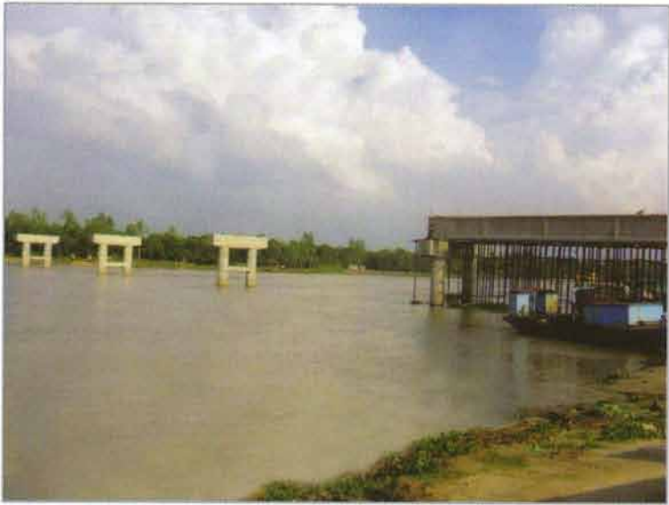
গার্ডার নির্মাণ কাজ