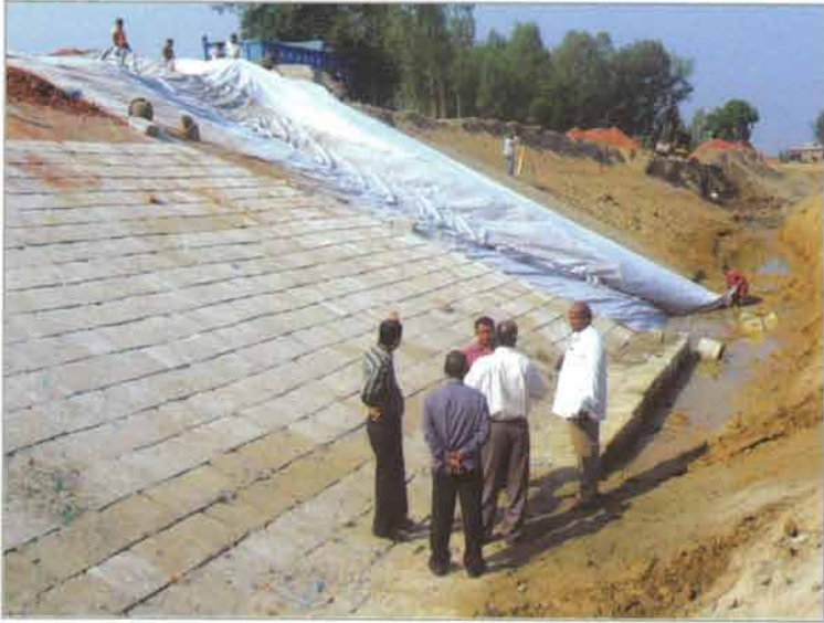
নদী শাসনের কাজ