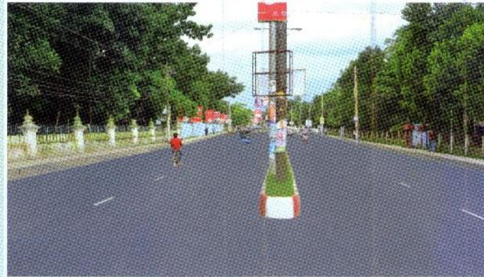
ফুটপাথর স্থাপন ও সড়ক সংস্কার