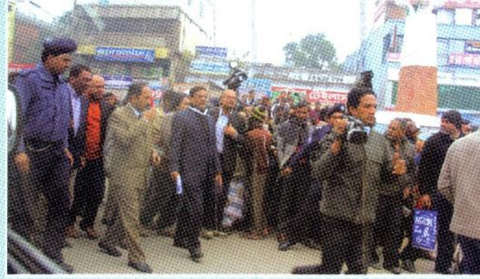
নির্মাণ কাজ পরিদর্শনে মাননীয় মন্ত্রী

রংপুর বিভাগীয় শহরের জন্য প্রকল্পটির গুরুত্ব অপরিসীম। নগরীর যানজট নিরসনে কার্যকরী ভূমিকা রাখার পাশাপাশি শহরের সৌন্দর্য বর্ধন এবং আধুনিক নগরী হিসাবে গড়ে তোলার অপার সম্ভাবনা সৃষ্টি হয়েছে। এ প্রকল্প বাস্তবায়নের সাথে যানজট নিরসনের মাধ্যমে নগরবাসীর জীবনের গতি এবং স্বাচ্ছন্দ এসেছে এবং সর্ব উত্তরের বিভাগীয় শহরের জনগনের জীবনযাত্রার মানোন্নয়ন ঘটেছে।