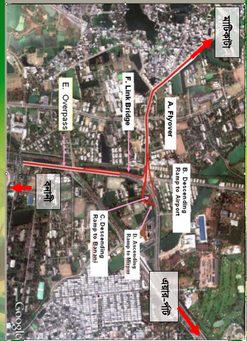
ওভারপাস এ্যালাইন-ম-ন্টর ছবি

জাতীয় উন্নয়ন পরিকল্পনার একটি অন্যতম অধ্যায় যোগাযোগ ব্যবস্থার উন্নয়ন। উন্নয়ন প্রক্রিয়া সম্পাদিত হয় প্রকৃতির নিজস্বতাকে কিছুটা এলোমেলো করে। বনানী রেলক্রসিং এর উপর ওভারপাস নির্মাণ যোগাযোগ ব্যবস্থা তথা জাতীয় উন্নয়ন পরিকল্পনার একটি অংশ। ওভারপাস নির্মাণের সময় প্রকৃতির যে disturbance হয়েছে তার কিছুটা পুষিয়ে দিতে এই ঢাকা গার্ডেন একটি সম্পূর্ণ ভিন্ন ও নতুন প্রয়াস। ঢাকা গার্ডেন, concrete এর তৈরী ঢাকা শহরের মাঝে কিছুটা সবুজের বিস্তার। যখন কেউ ওভারপাস দিয়ে অতিক্রম করবে তখন যান্ত্রিক জীবনের গরম উষ্ণ আবহাওয়ার মধ্য হতে হঠাৎ কিছু সময় শীতলতার মধ্য দিয়ে অতিক্রম করবে। সেনানিবাস এর সম্মুখে অবস্থিত ছোট লেককে ঘিরে walk way, পার্ক, skating সহ ওভারপাস এর তথ্য কেন্দ্রের সমারহ হবে এই ঢাকা গার্ডেন। ঢাকার ইটের বসত বাড়ীর মাঝখানে সবুজের ছোয়ার অস্তিত্ব হিসাবে অবস্থান করবে এই ঢাকা গার্ডেন।