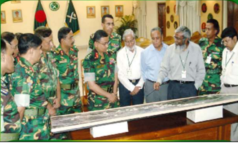
বনানী ওভারপাস প্রকল্প মডেল পরিদর্শন করছেন প্রাক্তন সেনা প্রধান