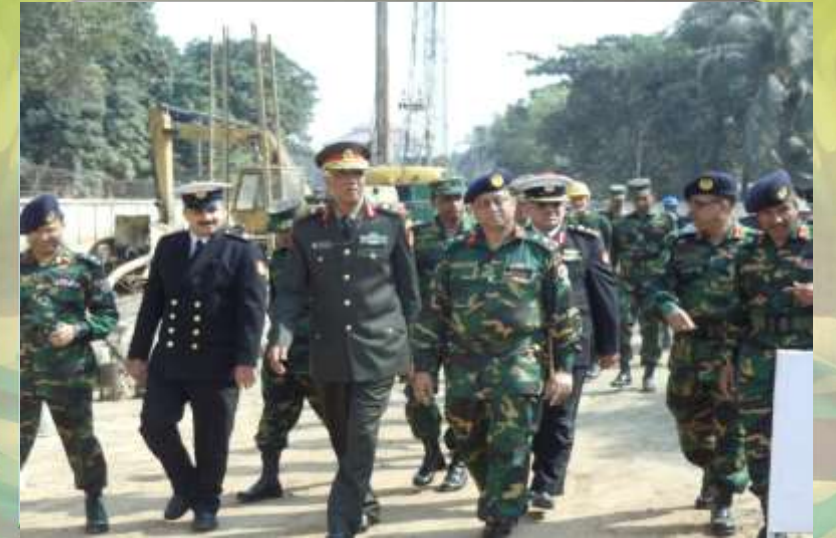
বনানী ওভারপাস প্রকল্প পরিদর্শন কর-ছেন কু-য়ত ডেলি-গশন