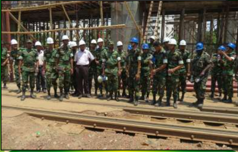
প্রকল্প পরিদর্শন কর-ছন এমআইএসটি'র শিক্ষার্থীগণ