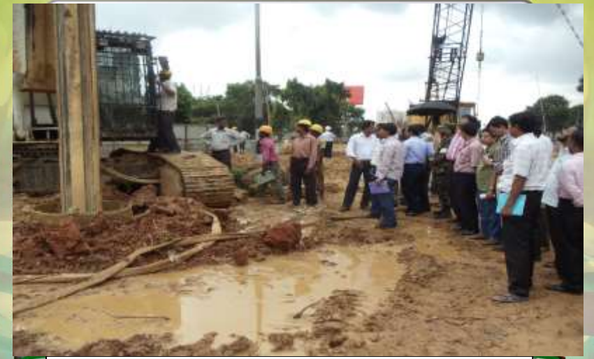
প্রকল্প পরিদর্শন করছেন এলজিইডি টিম