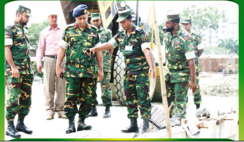
প্রকল্প নির্মাণ কাজ সরেজমিন তত্ত্বাবধান কর-ছেন প্রকল্প পরিচালক