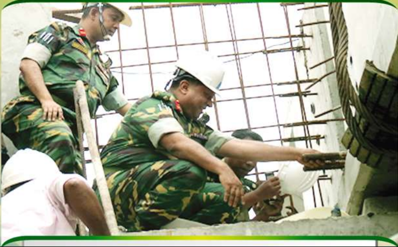
প্রকল্প নির্মাণ কাজ সরেজমিন তত্ত্বাবধান করছেন প্রকল্প পরিচালক