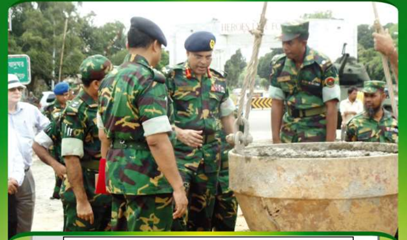
প্রকল্পের অগ্রগতি পরিদর্শন করছেন ই ইন সি