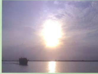
বিকীর্ণ হাওড়ের বর্ষা মৌসুমে দেশীয় নৌ চলাচলের দৃশ্য

প্রকল্পের মেয়াদ ০১ জানুয়ারী ২০১৫ হতে ৩০ জুন ২০১৮ পর্যন্ত। প্রকল্পটির এলাইনমেন্ট ইটনা উপজেলা পরিষদ থেকে চিলনী, শান্তিপুর, মাহমুদপুর, ঢাকী, বোরনপুর, মিঠামইন, ভাতশালা, কান্তল গ্রাম হয়ে অষ্টগ্রাম উপজেলা পর্যন্ত। প্রকল্পের আওতায় ৯১.৫২ হেক্টর ভূমি অধিগ্রহণ, ২৯.১৫ কিলোমিটার সড়কবীধ ও ৭.৪০ মিটার প্রশস্ত ফেল্ডবল পেভমেন্ট, ৫.০৯ লক্ষ বর্গমিটার সিসি ব্লক-জিওটেক্সটাইল সহ প্রোগ্রাম প্রটেকশন, মোট ৪৪ মিটার দৈর্ঘ্যের ৭টি আরসিসি বজ্র-কালভার্ট, মোট ১৫৪.৩৫ মিটার দৈর্ঘ্যের ৭টি আরসিসি সেতু ও মোট ৫৯০.৪৯ মিটার দৈর্ঘ্যের ৩টি পিসি গার্ডার সেতু নির্মাণ করা হবে।