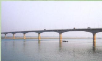
প্রক্ষেপিত ভাতশালা সেতু