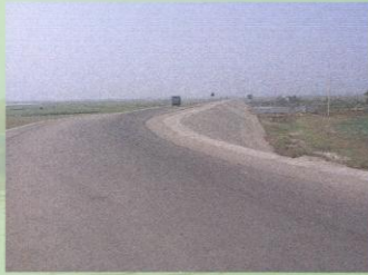
প্রক্ষেপিত সারাবহর যান চলাচলের উপযোগী মহাসড়ক