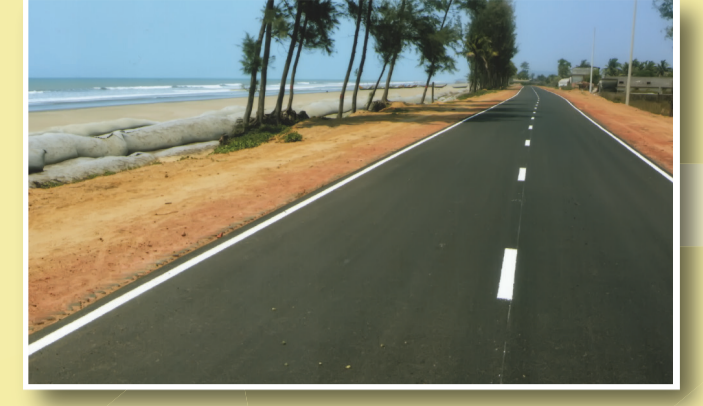
৮০ কিলোমিটার দীর্ঘ মেরিন ড্রাইভের একাংশ

সড়ক ও জনপথ অধিদপ্তর সড়ক পরিবহন ও মহাসড়ক বিভাগ সড়ক পরিবহন ও সেতু মন্ত্রণালয়