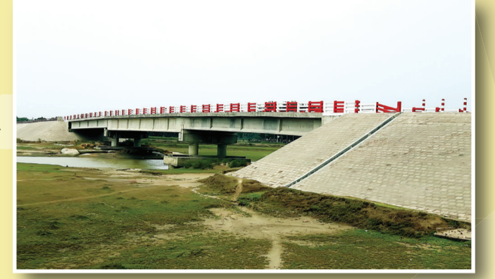
৪৪ কিলোমিটারে নির্মিত ৪০ মিটার পিসি গার্ডার ব্রিজ