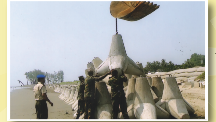
সাপারের চেউ থেকে মেরিন ড্রাইভ ভাসনরোধে ব্যবহৃত ট্রেপাউড