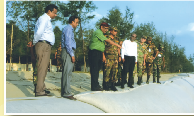
নির্মাণ কাজ পরিদর্শন করছেন সচিব, সড়ক পরিবহন ও মহাসড়ক বিভাগ