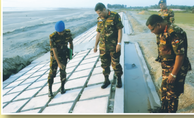
নির্মাণ কাজ পরিদর্শন করছেন সেনাবাহিনী প্রধান বাংলাদেশ সেনাবাহিনী