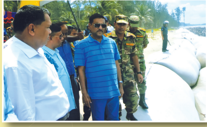
নির্মাণ কাজ পরিদর্শন করছেন মাননীয় মন্ত্রী সড়ক পরিবহন ও সেতু মন্ত্রণালয়