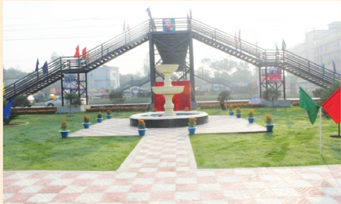
বঙ্গবন্ধু শেখ মুজিবুর রহমান কৃষি বিশ্ববিদ্যালয়ের সম্মুখে নির্মিত ফুটওভার ব্রিজ ও পার্ক