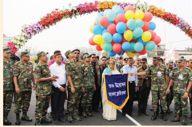
মাননীয় প্রধানমন্ত্রী কর্তৃক মাওনা ফ্লাইওভার উদ্বোধন