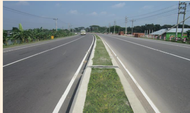
মিডিয়ানসহ ৪-লেনে উন্নীত জয়দেবপুর-ময়মনসিংহ মহাসড়ক