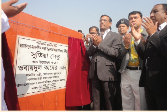
মাননীয় সড়ক পরিবহন ও সেতু মন্ত্রী কর্তৃক সুতিয়া সেতু উদ্বোধন