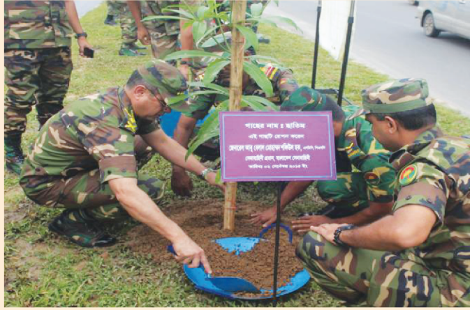
মাননীয় সেনাবাহিনী প্রধান কর্তৃক প্রকল্প এলাকায় বৃক্ষরোপণ কর্মসূচি উদ্বোধন